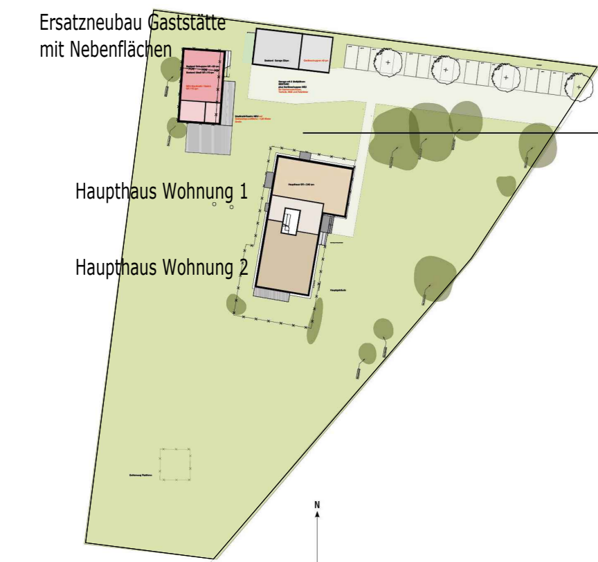
VEP Erdgeschoss M 1 : 1.000

Beispielarstellung: es ist eine abweichende Abgrenzung der Wohnungen zulässig.