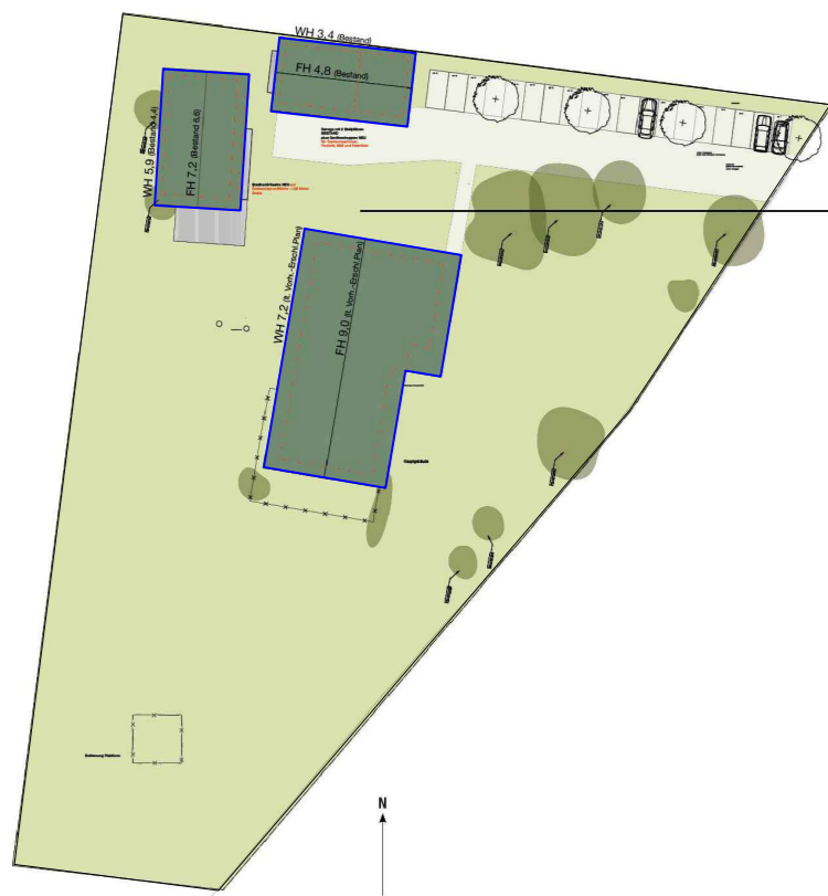
VEP Dachaufsicht M 1 : 1.000

Beispielarstellung: es ist eine abweichende Abgrenzung der Wohnungen zulässig.