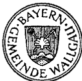
Bastian Eiter Erster Bürgermeister